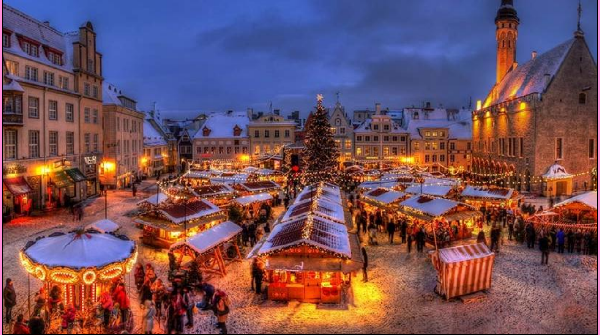
Pärnu ja minä