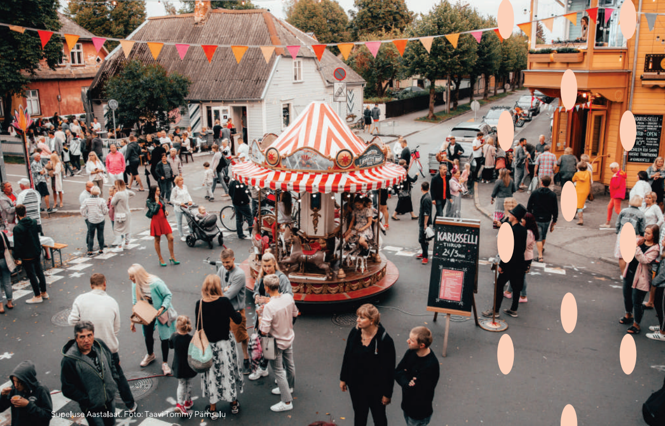
Supeluse Aastalaat.