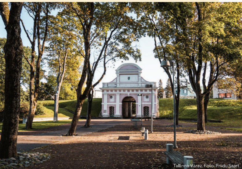
Tallinna Värav.

Tallinna värav on ainus 17. sajandist säilinud vallivärav Baltimaades.