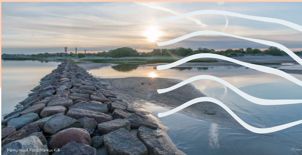
Pärnu muul.

Pärnumaa rannajoon on 250 km pikkune, meie kutsume seda Romantiliseks Rannateeks. Siit peaks sobiva paiga mere ääres leidma igaüks. www.rannatee.ee