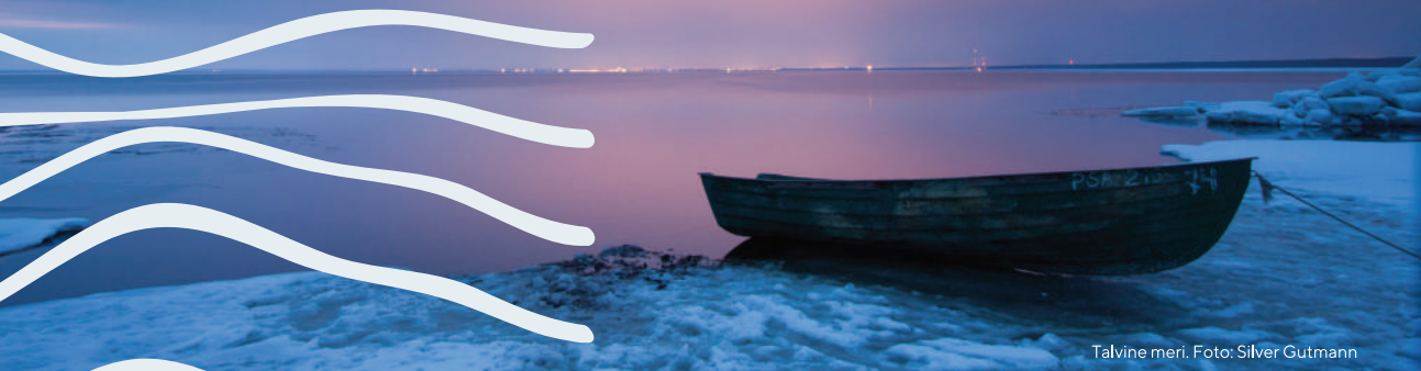
Talvine meri.

Pärnus ootavad sind spaad, muuseumid, kontserdid ja kesklinna liuväli. Talvise Pärnu jõe jääkaas kihab varahommikust hilise õhtutunnini kalameestest. Talvine meri on omaette vaatamisväärsus.