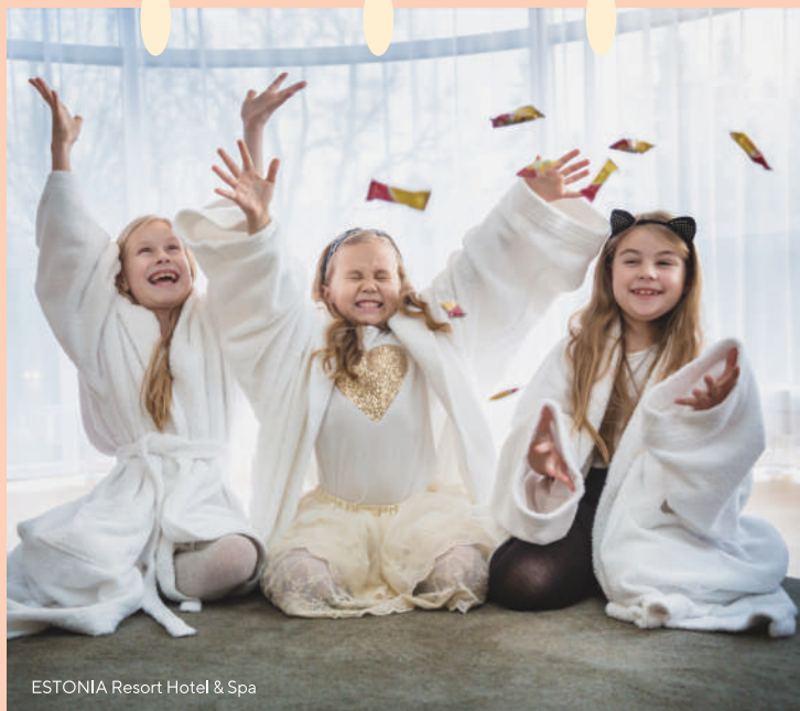
ESTONIA Resort Hotel & Spa

OKOK Vaba Aja Keskus – mitmekülgne ajaveetmise koht, kus saab mängida bowlingut, noolemängu ja GlowGolfi, mis on inspireeritud Eestimaa loodusest, paikadest ja aastaegadest. www.okok.ee