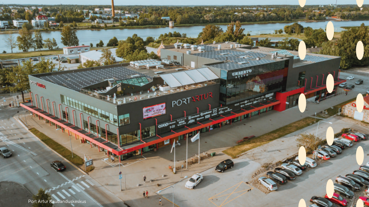
Port Artur Kaubanduskeskus