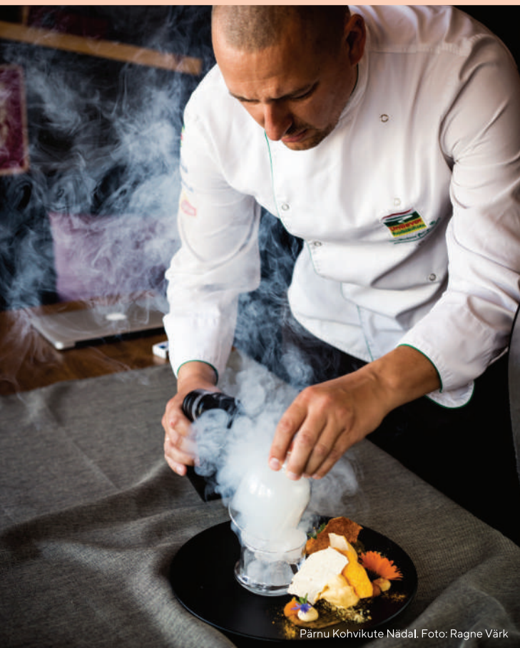
Pärnu Kohvikute Nädal.

Rannahotelli restoran www.rannahotell.ee