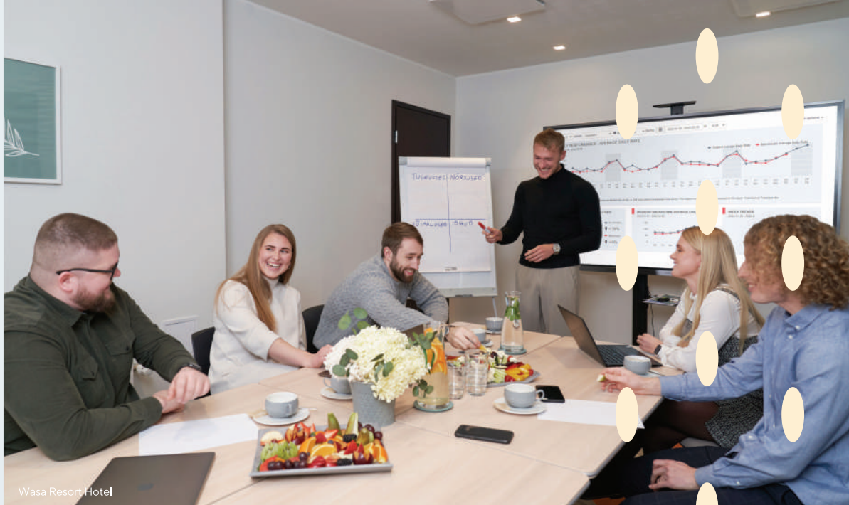
Wasa Resort Hotel