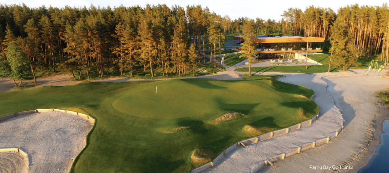
Pärnu Bay Golf Links