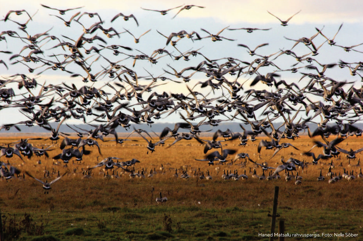
Haned Matsalu rahvuspargis.