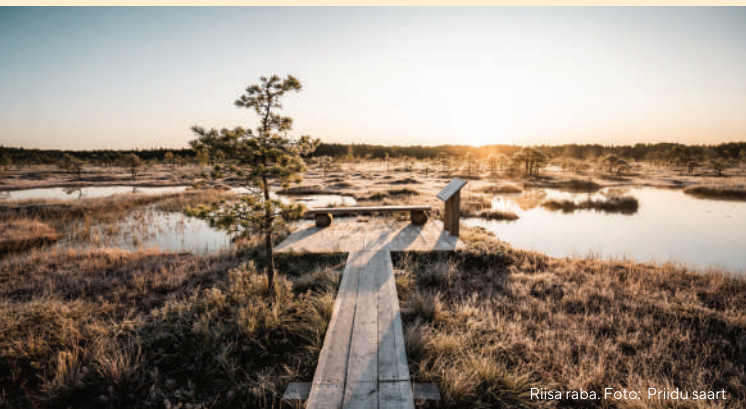
Riisa raba.

Soomaa on haruldane paik viie aastaajaga: kevad, suvi, sügis, talv ja suurvesi. Soomaa arvukad matkarajad väärivad küllastamist igal ajal, kuid kustumatuid elamusi pakub just suurvee aegne loodus. Üleujutusperioodil saavad veematkahuvilised jõgede sängidest välja aerutada ja isegi metsa vahel kanuuga sõita.