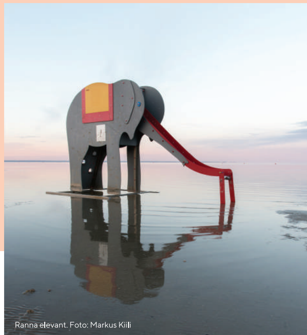
Ranna elevant.

Pärnu on ka romantiliste jalutuskäikude, armastajate ja esimese suudluse linn. Jalutamiseks sobivad ideaalselt näiteks Pärnu muul ja rannapromenaad. Elevant on Pärnu ranna üheks sümboliks – kunagi olid veepiiril liu laskmiseks kaks puidust elevanti.