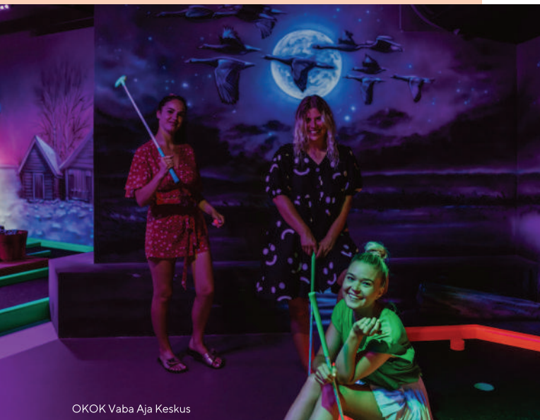
OKOK Vaba Aja Keskus

Ranna Rantšo koduloomade park (73 km) – Siit leiad hobused, kitsed, härjad, jäneseid, koerad, kassid ja suure linnupere. Kokku elab Ranna Rantšos ligi 300 looma ja lindu. www.rannarantso.com