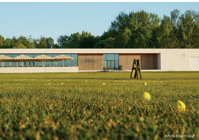
White Beach Golf