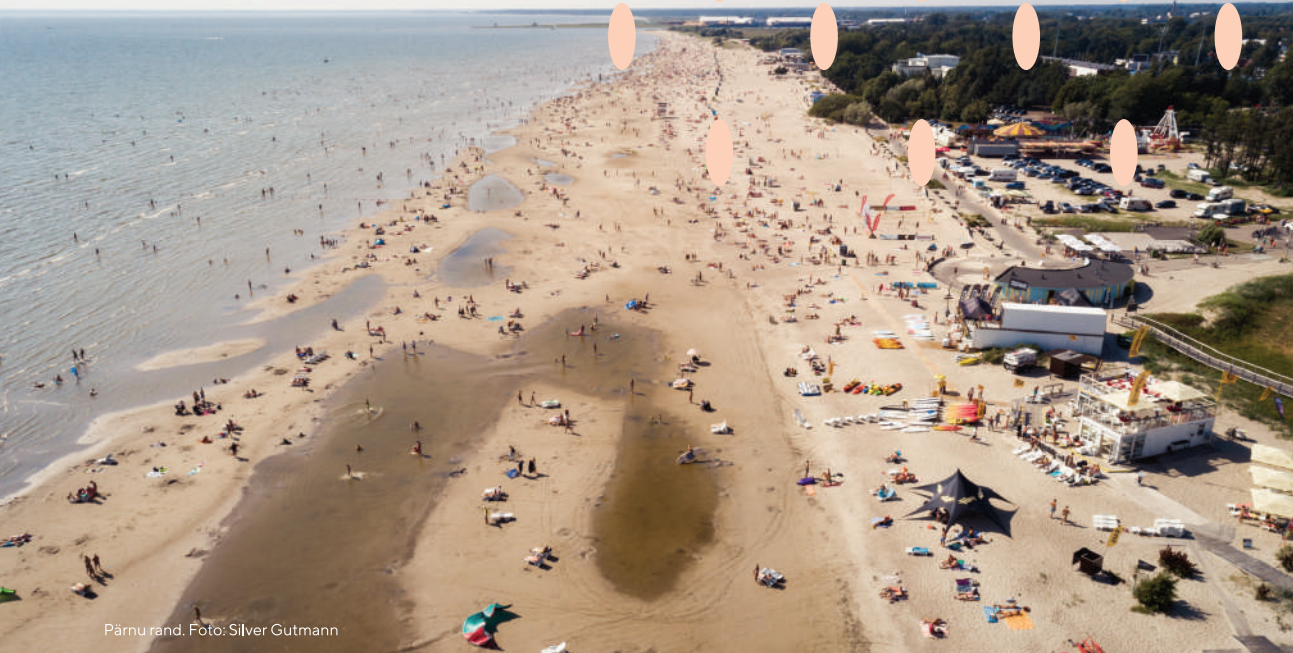
Pärnu rand.