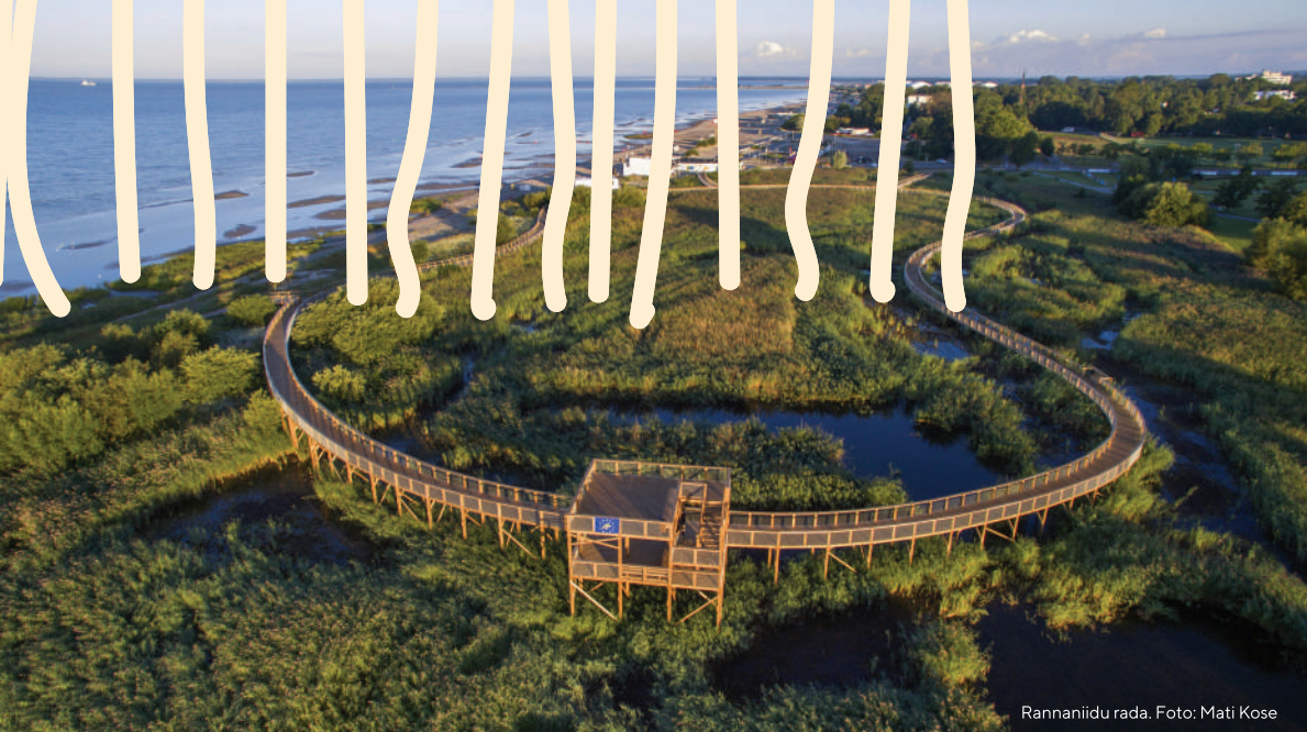
Rannaniidu rada.