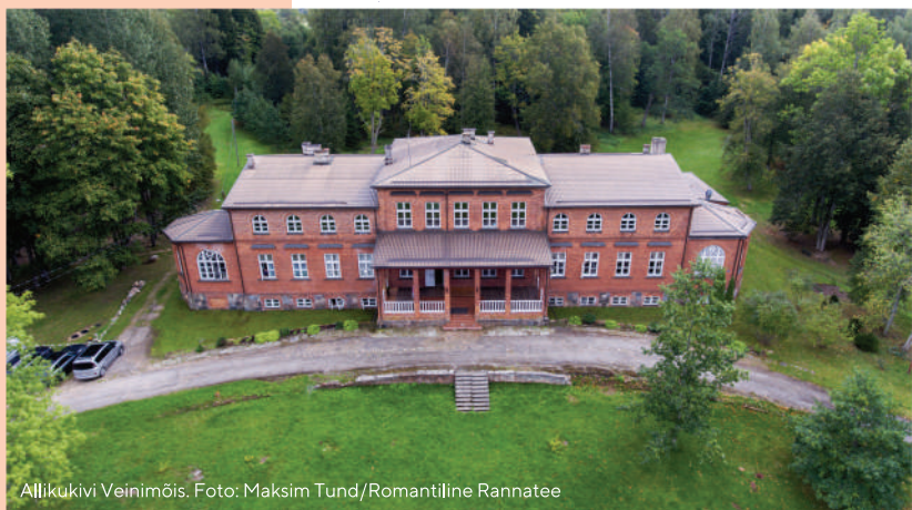
Allikukivi Veinimõis.

www.siidritalu.ee www.jaanihanso.ee www.veinitall.ee www.allikukivi.ee www.pootsiveinimois.ee