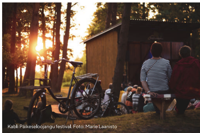
Kabli Päikeseloojangu festival.

Kui otsid midagi privaatsemat, siis tutvu väikeste rannaküladega nagu Kastna, Liu, Marksa või Saulepa.