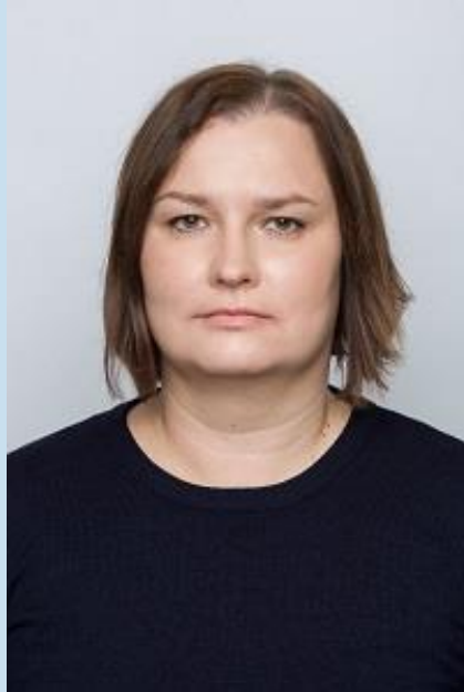
Ave Lääne Turismiarenduse juht