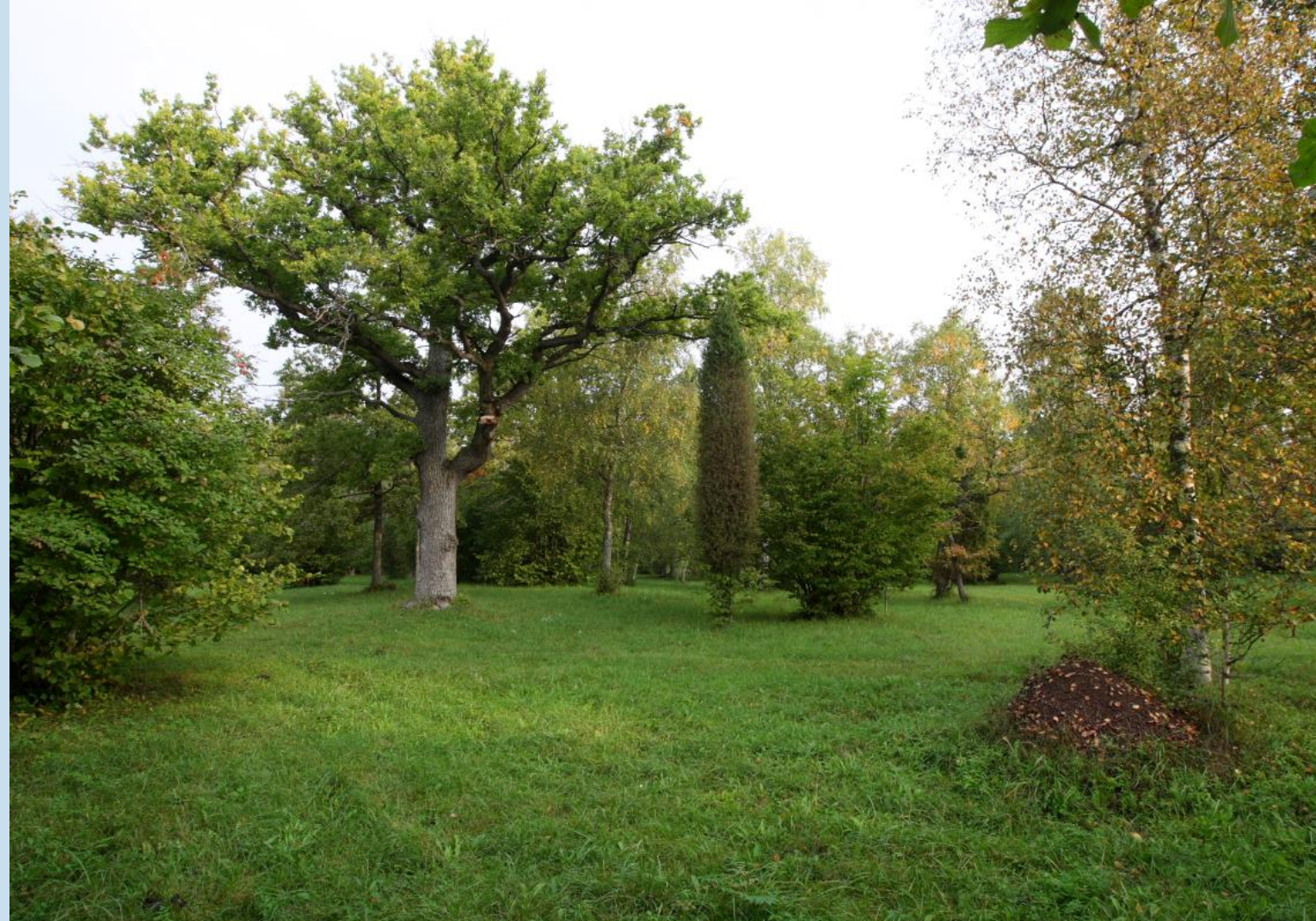
Laelatu puisniit