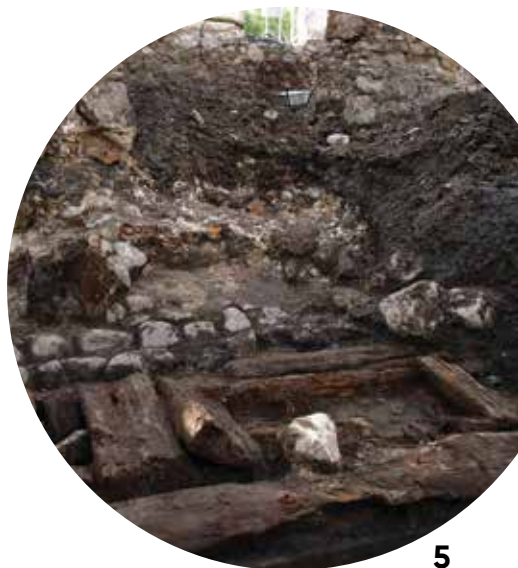
Pärnu linnamüüri Jõevärav. Puitsillutis ja läänepoolne torn (vaade idast)