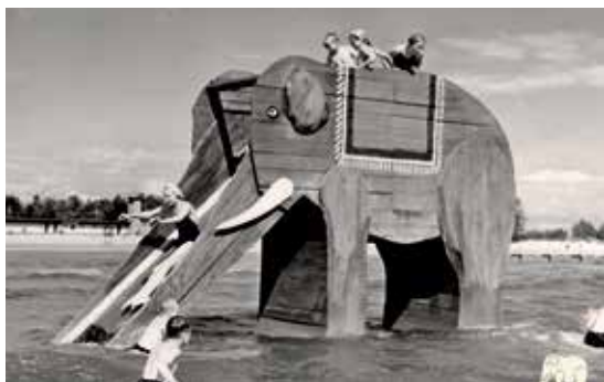
Rannaelevant 1950. aastate lõpp – 1960. aastate algus

endiste aegade paradiisliku rannakultuuri järjepidevuse kandjaks nõukogude ajal oli tänaseni toimiv nudistlik naisterand ehk „naiste paradiis“?