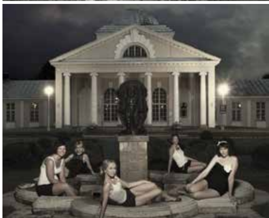
Suvitajad Mudaravila ees 1930ndate algus / 2013