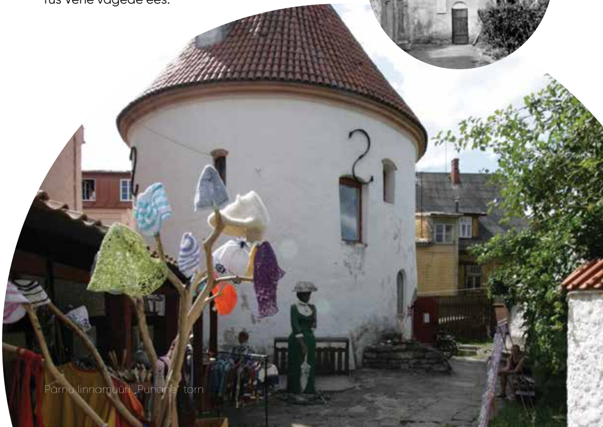
Pärnu linnamüüri „Punchi” torn