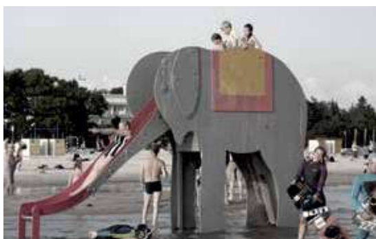
Rannaelevant 2013. aasta