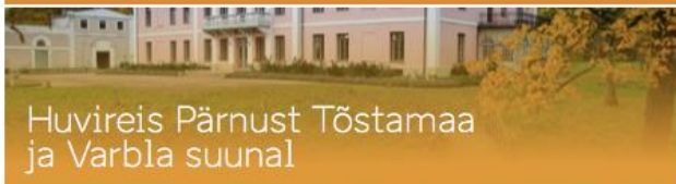
Huvireis Pärnust Tõstamaa ja Varbla suunal