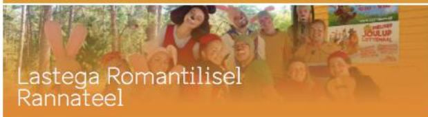
Lastega Romantilisel Rannateel