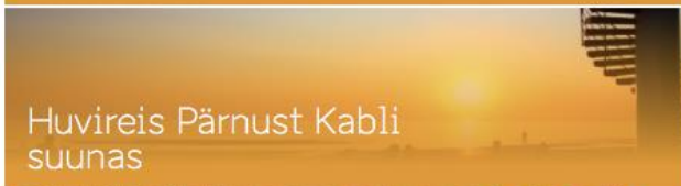
Huvireis Pärnust Kabli suunas